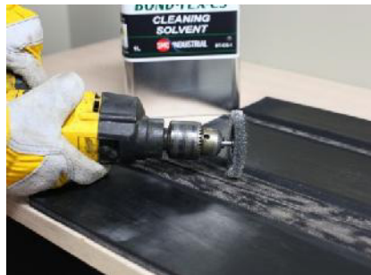
Pula el área de reparación.