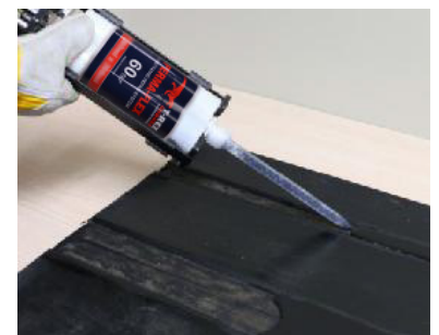
Aplique el material de reparación Perma-Flex.