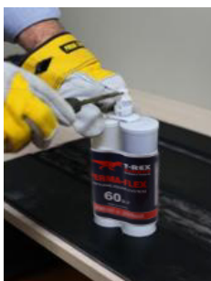
Retire el sello del tapón.