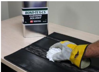
Limpie con disolvente el área de reparación.