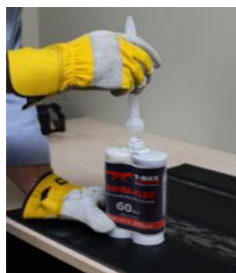
Enrosque el mezclador estático.