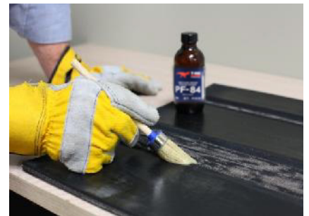
Aplique la imprimación.