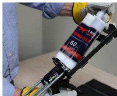
Inserte el cartucho en el dispensador.