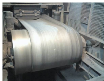
Antes da instalação do Tru-Trac

O sistema para controlo de correias transportadoras Tru-Trac foi testado em instalações de todo o mundo. O rolo Tru-Trac é protagonista de muitas histórias de sucesso nos Estados Unidos, Canadá, África e Europa.