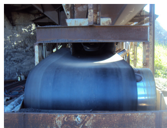
Antes da instalação do Tru-Trac