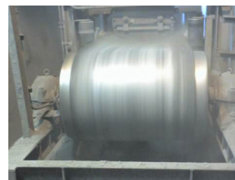
Após a instalação do Tru-Trac