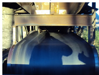
Após a instalação do Tru-Trac

A nova tecnologia de controlo Tru-Trac encontra-se disponível para quase todas as larguras de correias transportadoras e, opcionalmente, pode ser fabricada de acordo com as especificações do cliente. O rolo de controlo Tru-Trac é fornecido com uma superfície de borracha vulcanizada a quente. O fabrico do modelo com dois rolos garante um isolamento perfeito. Nenhum rolo de controlo existente no mercado é comparável ao rolo Tru-Trac.