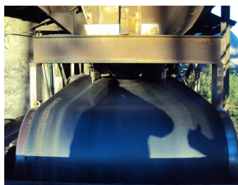
После установки Tru-Trac

Новая центрирующая технология Tru-Trac подходит к почти всем значениям ширины конвейера, однако есть возможность изготовить центрирующий трекер с учетом требований заказчика. Поверхность поставляемого Tru-Trac центрирующего трекера изготовлена из вулканизированного каучука (горячая склейка). Системой из двух подшипников обеспечивается максимальное уплотнение. Tru-Trac-центрирующий трекер не с чем сравнить.